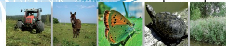
Fauche de prairie