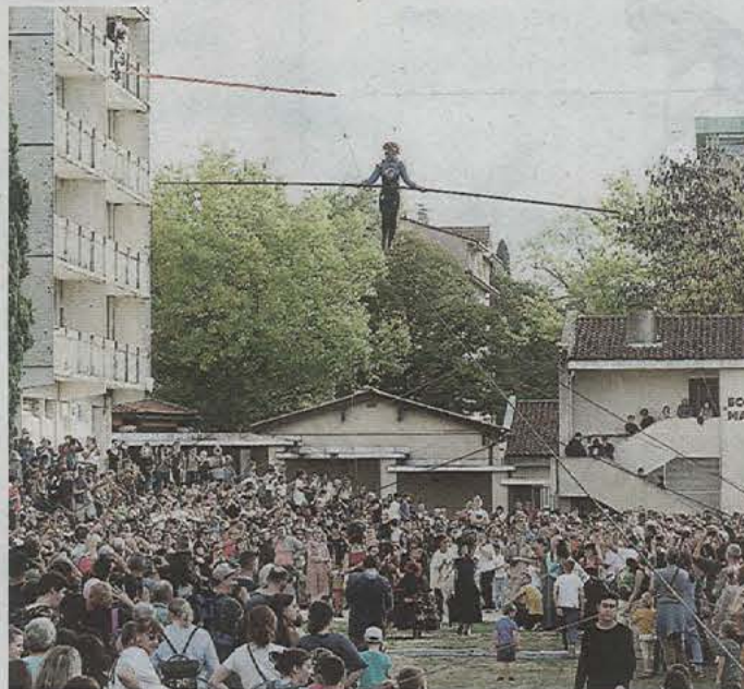
Plusieurs centaines de personnes ont assisté à la traversée de la funambule.

Suspendue à une tyrolienne, une jeune artiste transporte alors un balancier de funambule et le remet aux jeunes enfants qui sont partie prenante de « Traversée ». Les uns après les autres, les écoliers montent sur le fil, esquissent quelques pas et réalisent, pour les plus à l'aise, des figures sous les applaudissements des spectateurs.