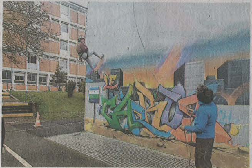
Descente en rappel au pied du bâtiment B au Garros.