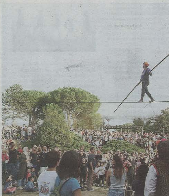
La « Traversée », de la funambule de la compagnie Basinga au Garros était l'un des temps forts du festival.

Au total, les organisateurs ont donc compté près de 8 500 festivaliers qui ont