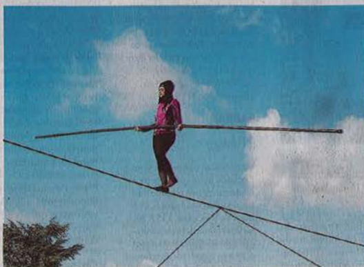
La funambule a déjà effectué des traversées au Garros.

Le travail a débuté dès lundi, avec un atelier pour les enfants de l'école Marie-Curie. À partir des costumes issus des précédentes représentations de la compagnie, ailleurs en France, ils vont apporter leur touche aux vêtements, les