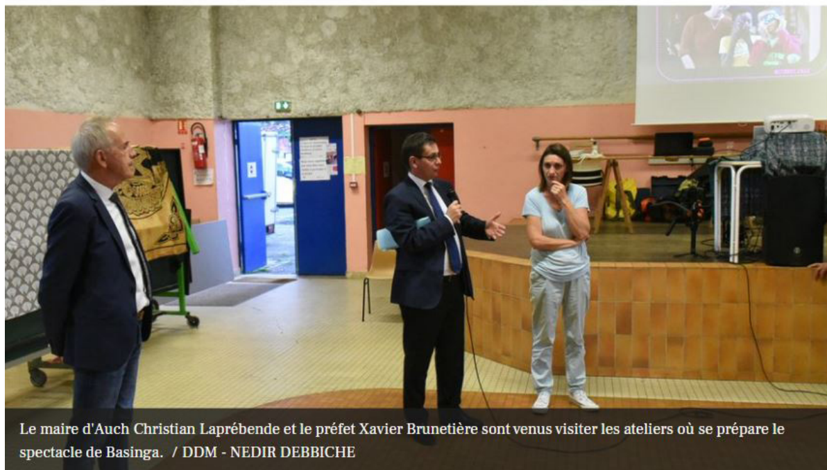
Le maire d'Auch Christian Laprèbende et le préfet Xavier Brunetière sont venus visiter les ateliers où se prépare le spectacle de Basinga.

Le Circa draine vers le Gers les plus grands artistes du monde. Cette année, ce sont 21 spectacles professionnels qui sont programmés, ainsi que 10 autres proposés par des écoles de cirque actuel, pour 85 représentations dans 16 lieux différents, et plus de 200 artistes engagés, venus de nombreux pays.